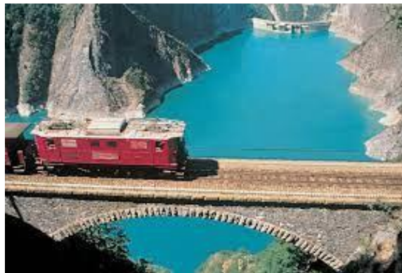
Barrage de Monteynard