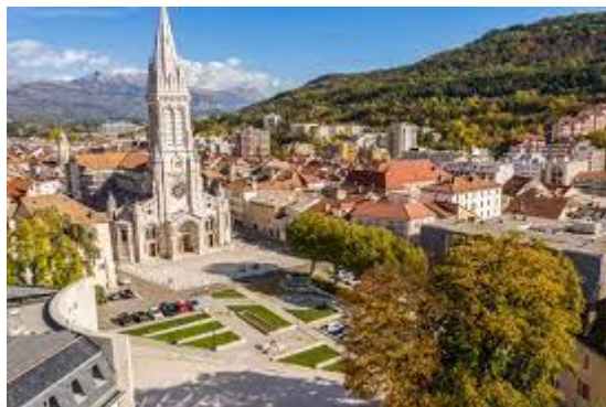
Gap : Saint Arnoux

En début d'après-midi, visite guidée (~1h45) de la ville. Vous traverserez le temps, de l'époque romaine à l'époque moderne, par l'évocation des personnages illustres ou méconnus ayant marqué la vie de la ville et apprécierez les anecdotes. Vous découvrirez la Cathédrale Notre Dame et Saint Arnoux.