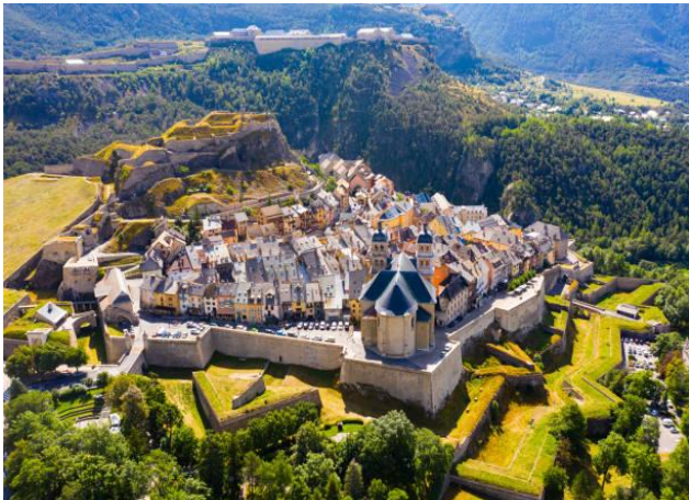
Briançon : Citadelle