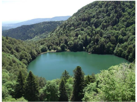
Lac du Grand Ballon